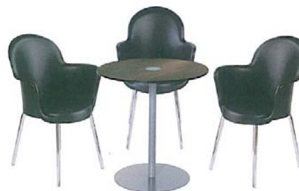
Table seule : 55 euros ht