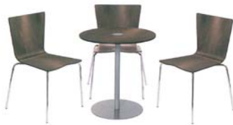
Table seule : 55 euros ht