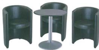
Table seule : 55 euros ht