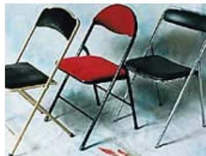
Chaises conférence pliante