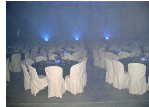
Housse pour chaise plastique