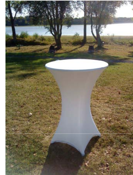
Mange debout bois habillé avec coton gratté