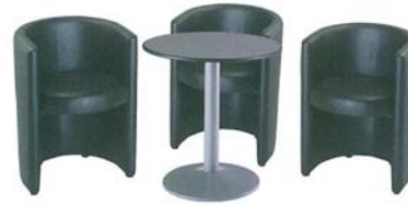
Table seule : 55 euros ht