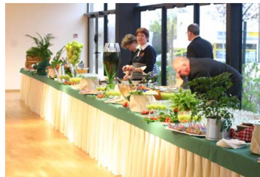
Table rectangulaire 2,50 x 0,8 m