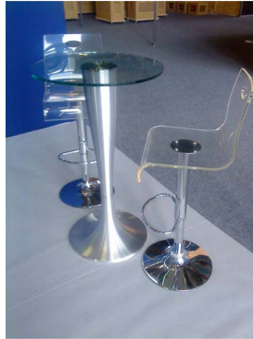
Tabouret haut plexi Mange debout verre et pieds chromé