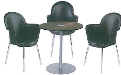
Table seule : 55 euros ht