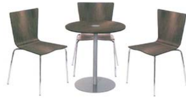
Table seule : 55 euros ht