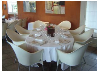
Table ronde diam 1,60 m 8 à 10 personnes