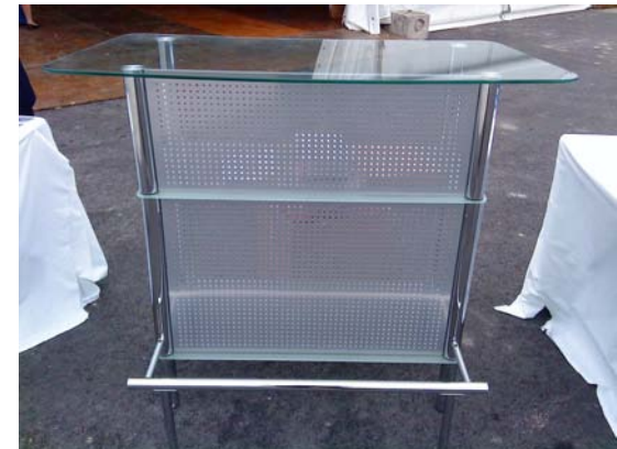
Comptoir verre et chrome 60 euros HT