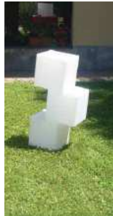
Table basse Tris blanche polypropylène éclairante 40 euros HT