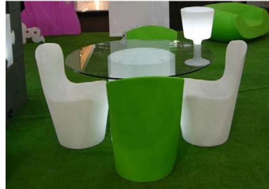
Siège chauffeuse Zoé blanc polypropylène éclairant